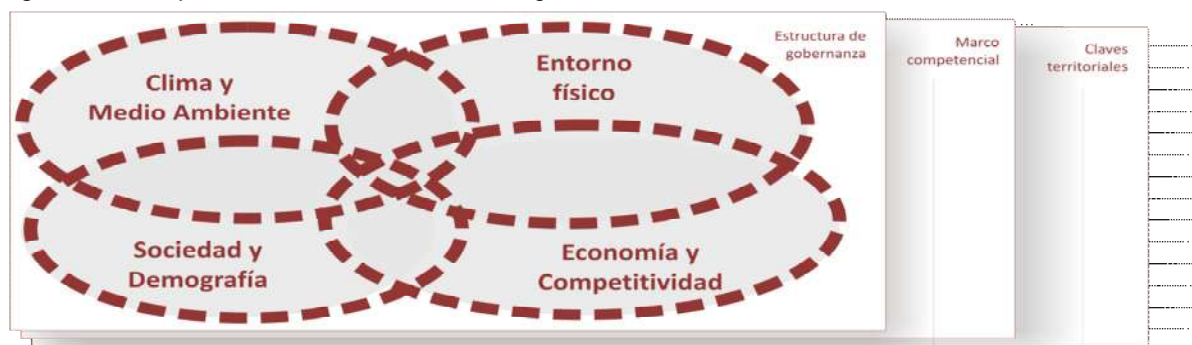
Figura 2. Principales ámbitos del análisis integrado.

El objeto de este análisis es conocer en profundidad las principales debilidades y amenazas que afectan al entorno urbano así como sus fortalezas, y los principales factores y claves territoriales de su desarrollo para abordar los múltiples retos a los que se enfrentan las áreas urbanas, transformando éstos en oportunidades.